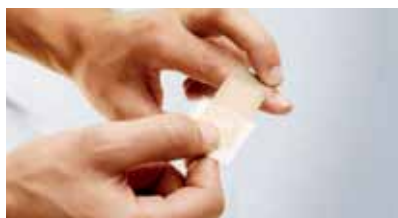
...és egy kézzel is könnyen felragasztható.